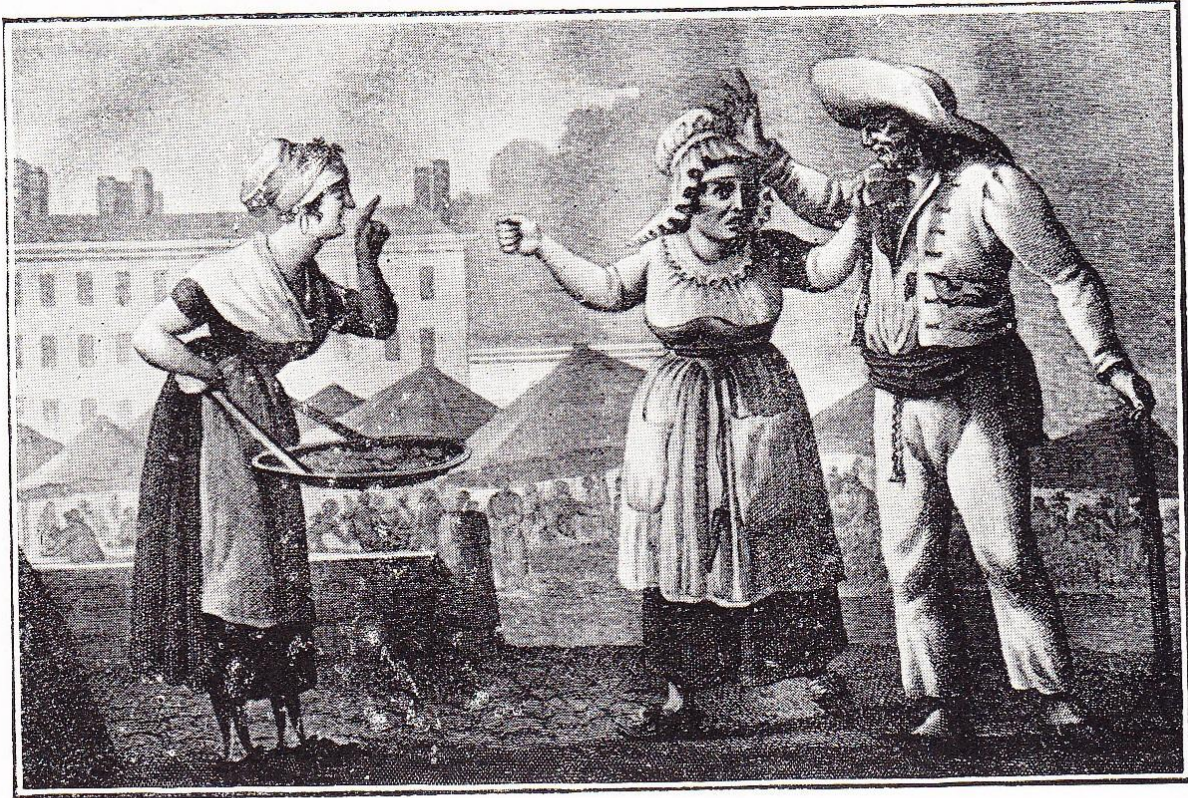
LE FORT DE LA HALLE.