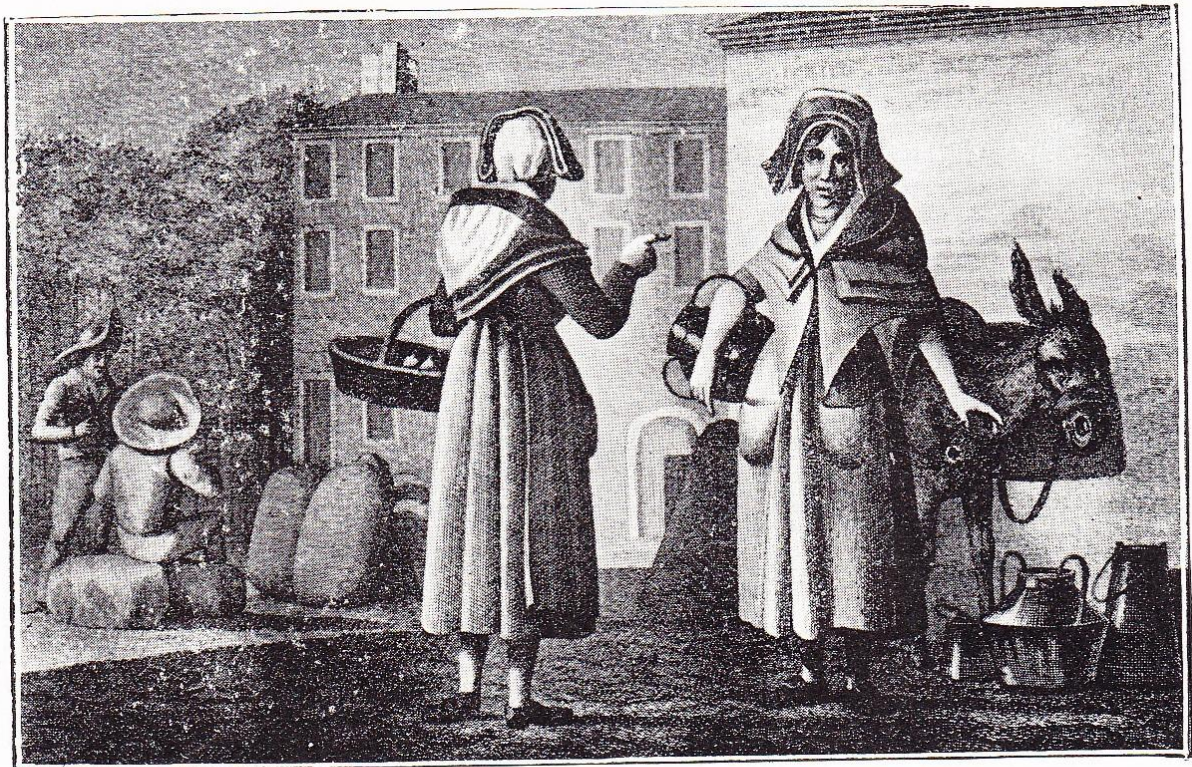
LES LAITIÈRES DE LA HALLE.

D'après les gravures du Voyage à Paris d'un Hollandais en 1802 .